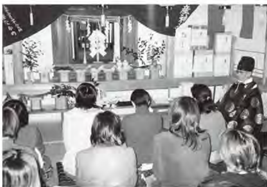
▶多くの妊婦さんで賑わいます。

安産神社の帝釈天と葛牧への渡船場。この組み合わせは、葛飾柴又の帝釈天と矢切りの渡しそのままです。もしかすると来年のお祭りあたりに、あのフーテンの寅さんが、ひよっこり現れるかもしれませんね。