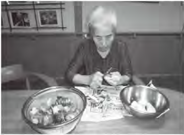
▲里芋の皮むきも慣れた手つきです。

認知症になっても、自分らしく生活したいとだれも思います。認知症になつたら新しいことを覚えるのは難しいけれど、今までやってきたことはできるということを聞いたことはありませんか。認知症と言っても、個々によりその症状は様々です。 ここではグループホームかわばた荘の取り組みを紹介します。