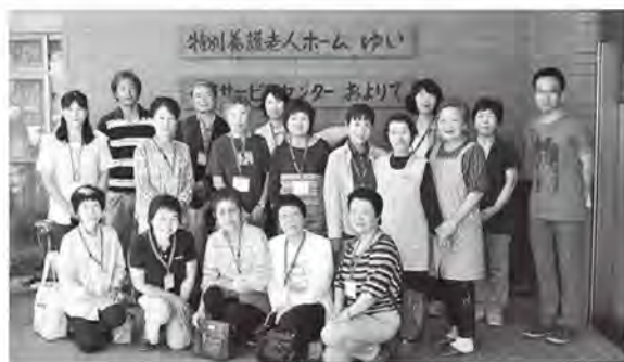
▲長野県の施設へ見学にでかけました。

平成19年8月からは、入居者の方の話し相手としてサンシャインで傾聴ボランティアを続けています。