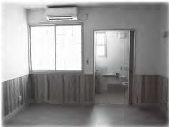
▶居室（トイレと洗面所付き）