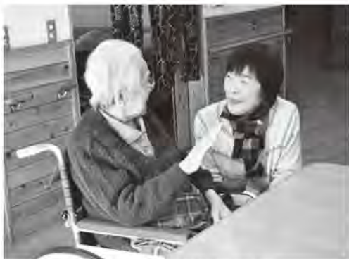
▲同じ目線で傾聴します。

平成17年6月、サンシャイン美濃白川から、入居者と一緒にお菓子を作る依頼があり、仲間とともに参加しました。