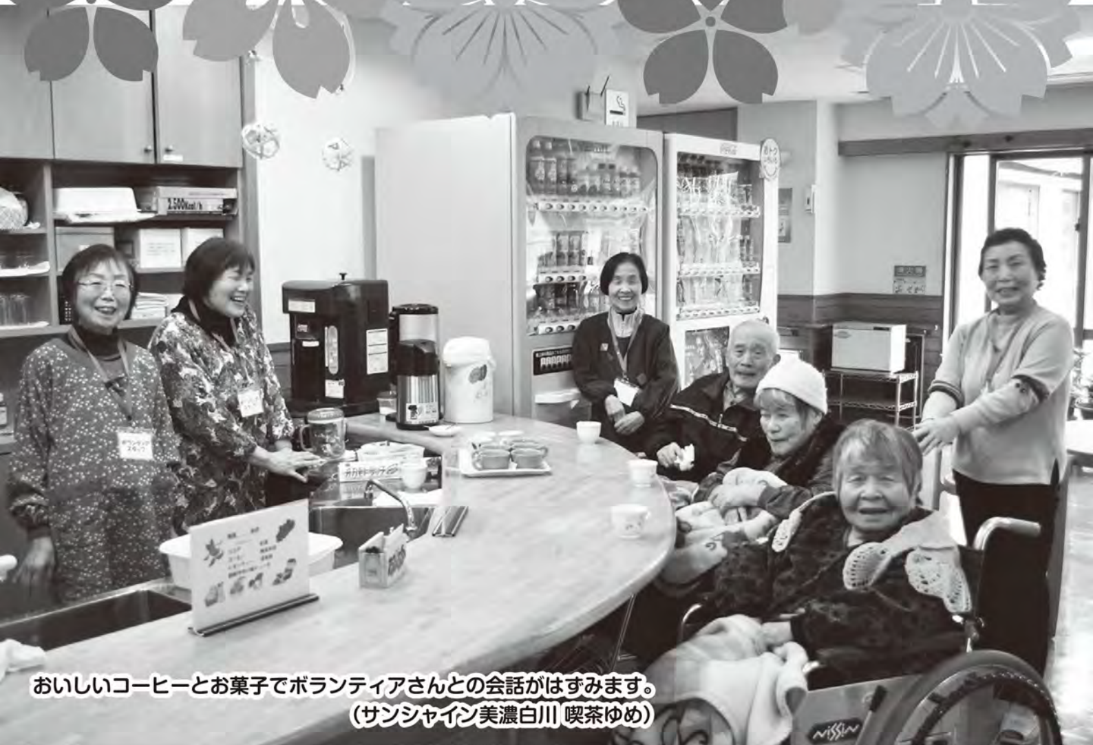
おいしいコーヒーとお菓子でボランティアさんとの会話がはずみます。 (サンシャイン美濃白川 喫茶ゆめ)